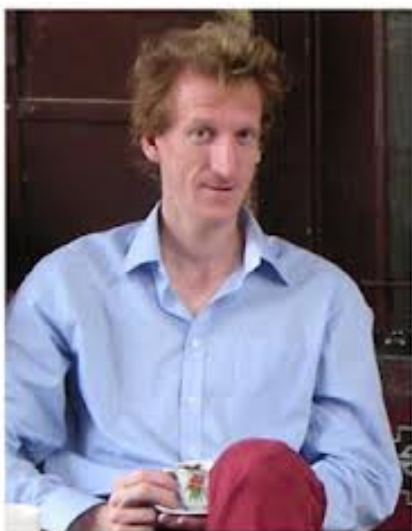
Ben Green y Terry Tao, dos grandes que prueban una de las conjeturas de Erdos en el caso más importante de los números primos.

se siguen resolviendo problemas planteados por él. El teorema de Green-Tao es el caso particular más importante de su conjetura que al momento de escribir estas líneas todavía no está resuelta.